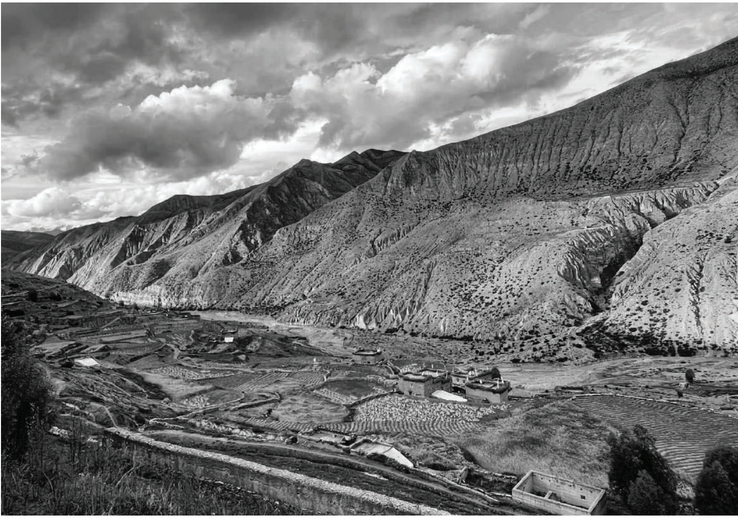
शे फोकसुण्डो गाउँपालिका-३ स्थित प्रशासकीय केन्द्र रहेको साल्दाङ उपत्यकामा रहेको उवा खेती ।