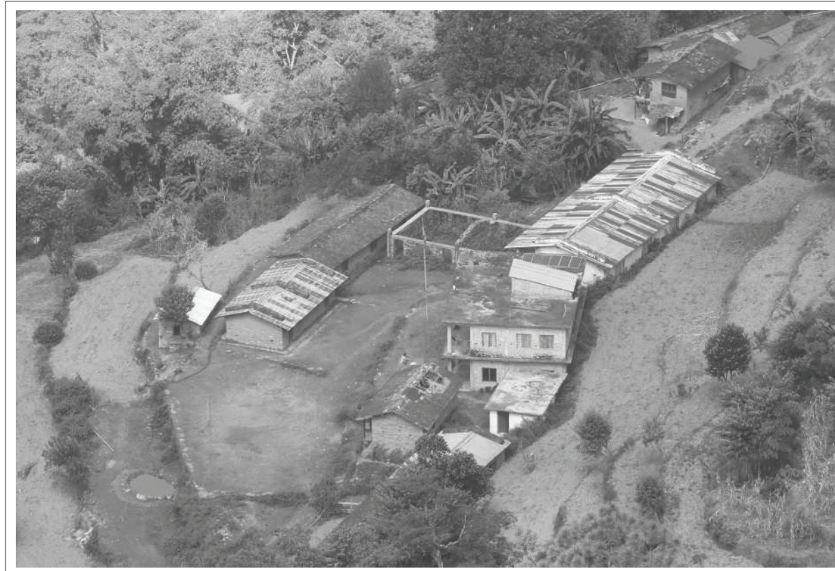
प्रयोगविहीन विद्यालय: रुकुम पश्चिमको चौरजहारी नगरपालिका-६ खालस्थित जनकल्याण माध्यमिक विद्यालयका प्रयोगविहीन भवन। पहिरोको जोखिमका कारण यहाँबाट विद्यालय रतामाटा सरेपछि उक्त भवनहरू प्रयोगविहीन भएका हुन्।

एस.एन.बि. लिमिटेड एण्ड म्यानेजमेन्ट प्राइभेट लिमिटेड (S.N.B. Hospitality And Management Private Limited) काठमाडौं म.न.पा. वडा नं. ४, बागमती प्रदेश