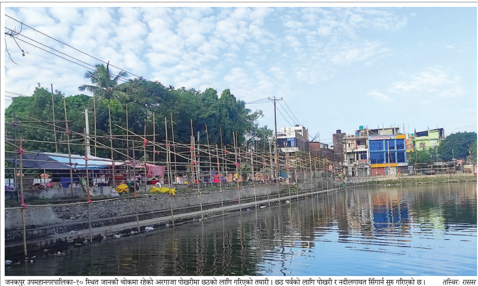
जनकपुर उपमहानगरपालिका-१० स्थित जानकी चोकमा रहेको अरगाजा पोखरीमा छटको लागि गरिएको तयारी। छट पर्वको लागि पोखरी र नदीलगायत सिँगान सुरु गरिएको छ।